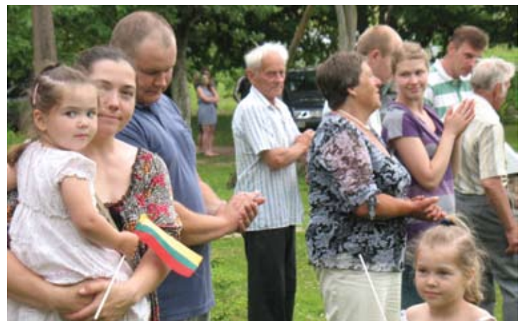
Kaimo suvažiavime nenuobodžiavo nei maži, nei dideli.