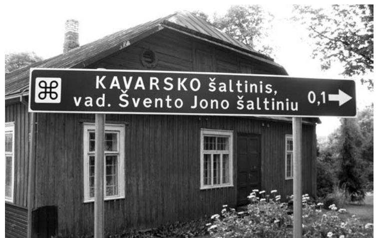
Kavarskiečius pikcina nuoroda prie šaltinio.